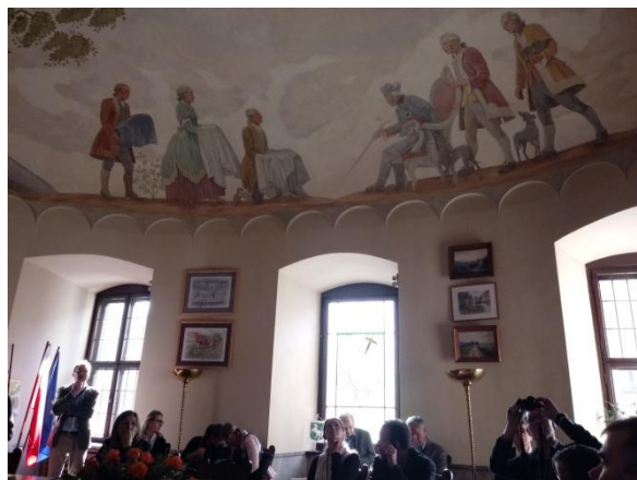
Wnętrza obiektów muzealnych w centrum Kowar

W godzinach popołudniowych zwiedzono wreszcie (wciąż pod przewodnictwem Pana Inż. Gawora) podziemną trasę turystyczną w kopalni „Liczyrzepa”, gdzie zapoznano się z różnymi aspektami jej funkcjonowania. Dyskusje na ten temat kontynuowano w godzinach wieczornych w obiekcie noclegowym.