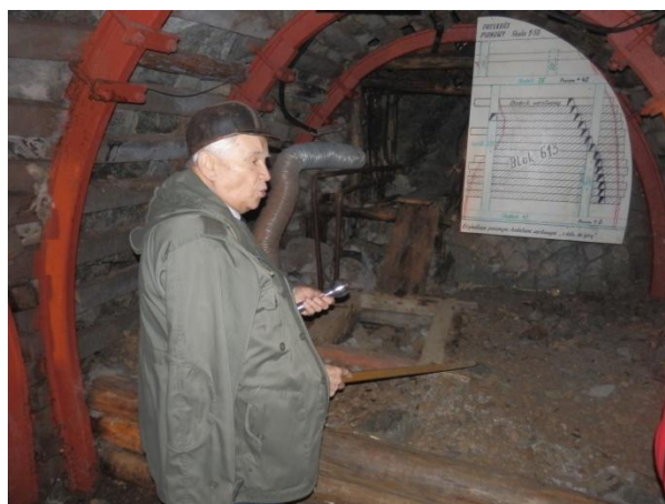
Wyrobiska kopalni „Liczyrzepa”