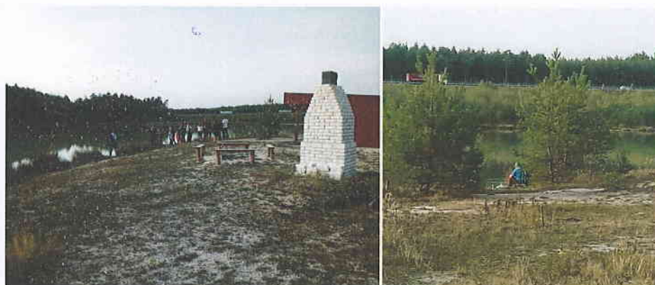
Fot. 6., 7. Rekultywacja w kierunku wodno-rekreacyjnym (kopalnia Zebrzydowa)

Pierwszy dzień wizyty objął również część terenową, w trakcie której (po wyprzedzającym szkoleniu z zasad BHP, dotyczącym przede wszystkim czynnego zakładu) uczestnicy zapoznali się z efektami rekultywacji wyrobisk zlikwidowanej kopalni „Zebrzydowa” (gmina Zebrzydowa), zrewitalizowanych w kierunku wodno-rekreacyjnym.