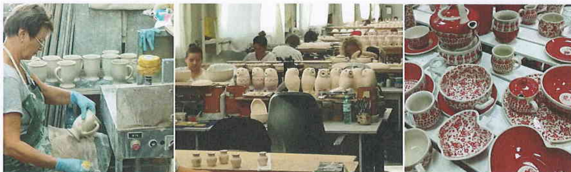
Fot. 3., 4. i 5. Kolejne etapy produkcji wyrobów gotowych („Żywe Muzeum Ceramiki”, Manufaktura w Bolesławcu)

Po lunchu udano się do „Żywego Muzeum Ceramiki” w Bolesławcu, gdzie uczestnicy zapoznali się z technologią produkcji znanych na całym niemal świecie wyrobów ceramicznych.