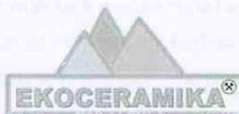
Rys. 1. Logo firmy Ekoceramika Sp. z o.o.

Tematem wiodącym wizyty studyjnej w kopalniach „Zebrzydowa” (zlikwidowanej) i „Zebrzydowa Zachód” (czynnej, częściowo zrehabilitowanej) było omówienie problemów rekultywacji terenów pogórnich, z uwzględnieniem najlepszych dostępnych technik tj. w sposób efektywny i bezpieczny, z poszanowaniem zasad zrównoważonego rozwoju. Miejsce spotkania wybrano nieprzypadkowo, gdyż rejon między Bolesławcem, a Zgorzelcem jest już od stuleci tradycyjnym zagłębieniem wydobywania i przetwórstwa iłó ceramicznych, które to surowce – eksploatowane tak odkrywkowo, jak i podziemnie (Bolko i Janina) – stanowią dla rekultywacji szczególne wyzwanie. Gospodarzem spotkania była spółka Ekoceramika z Bolesławca, której szefostwo (w osobie Członka Zarząd i Kierownika Ruchu Zakładu Górniczego) udzieliło wyczerpujących informacji o funkcjonowaniu przedsiębiorstwa. Łącznie w spotkaniu wzięło udział 25 osób (patrz załączona lista). Szczegółowy program przedstawiono w osobnym załączniku.