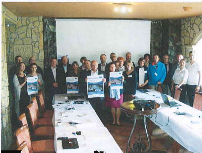
Fot. 10. Uczestnicy wizyty studyjnej w sali konferencyjnej Hotelu Garden w Bolesławcu