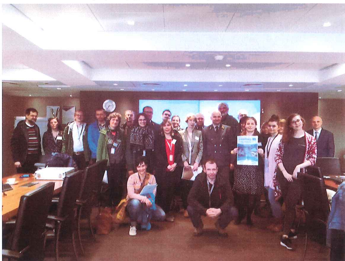
Fot. 13. Uczestnicy wyjazdu studyjnego do KGHM Polska Miedź S.A., 9-10 maja 2019 r. (Biurowiec O/ZG „Polkowice-Sieroszowice”).