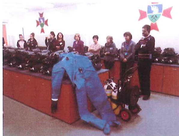
Fot. 7. i 8. Prezentacja o działalności Stacji Ratownictwa Górniczego oraz pokaz sprzętu ratowniczego.