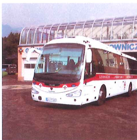
Fot. 9. i 10. Po lewej: pokaz działania sprzętu ratunkowego; po prawej: wóz bojowy Górniczego Pogotowia Ratunkowego rusza do symulowanej akcji.