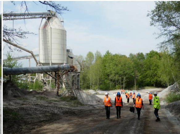
Fot. 5 Uczestnicy warsztatów podziwiają widok wyrobiska kopalni w Demitz-Thumitz