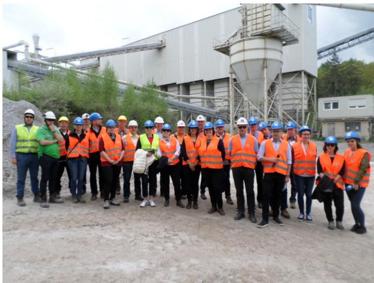
Fot. 11 Uczestnicy warsztatów na tle instalacji odpylającej w zakładzie Demitz-Thumitz.