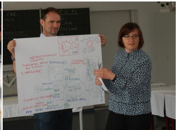
Fot. 9 Przykładowy plakat z propozycjami rozwiązań.