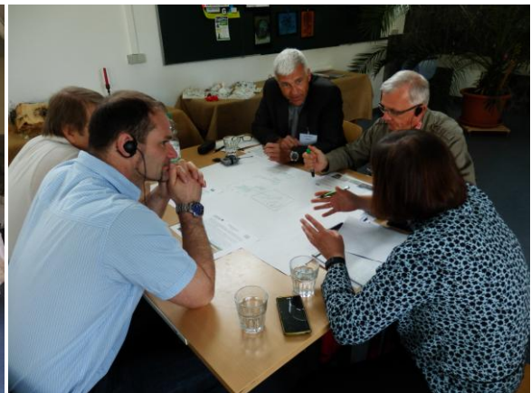
Fot. 7 Uczestnicy (4 zespoły) przy pracy nad rozwiązywaniem konfliktów.