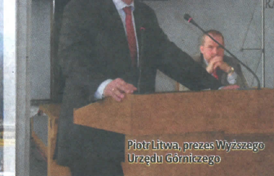
Piotr Litwa, prezes Wyższego Urzędu Górniczego

„...Gdy w 2002 roku środowisko związkowe występowało z inicjatywą przyjęcia przez Sejm RP uchwały ustanawiającej w Polsce Dzień Bezpieczeństwa i Ochrony Zdrowia w Pracy, mieliśmy za sobą trudne doświadczenia pierwszego dziesięciolecia transformacji polskiej gospodarki(...) W 2002 roku nie chcieliśmy tylko kolejnego symbolu i święta – dobrej okazji do kolejnej akademii. Chcieliśmy stworzyć platformę współpracy i współdziałania tych wszystkich, którzy pracę mogą uczynić bezpieczniejszą i zdrowszą – zmieniając jej warunki, eliminując