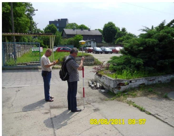
Fot. 4.1. Miejsce po zlikwidowanym szybie Gneisenau przy ul Słonecznej, w głębi budynek byłej dyrekcji kopalni